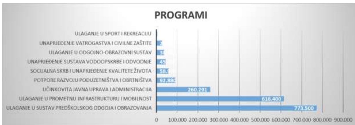
Slika 3 Rashodi po programima

Ukupni rashodi planirani su u iznosu od 1.752.921,00 €, od čega rashodi poslovanja iznose 659.421,00 €, a rashodi za nabavu nefinancijske imovine 1.093.500,00 €. Izdaci za financijsku imovinu i otplatu zajmova planirani su u iznosu od 65.000,00 €. Rashodi i izdaci raspoređeni su u Posebnom dijelu proračuna na aktivnosti i kapitalne projekte unutar sljedećih programa: